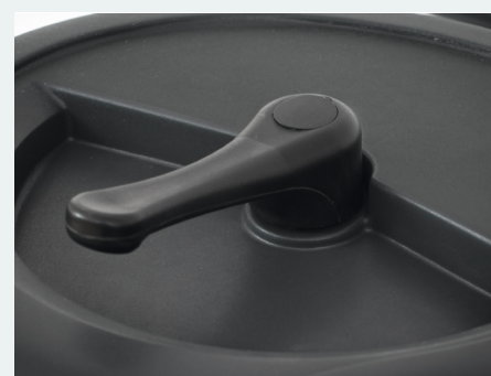
Secouage du filtre manuel