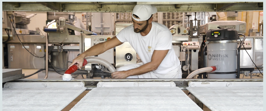
Sa taille compacte lui permet d'atteindre facilement tous les recoins de la zone de production