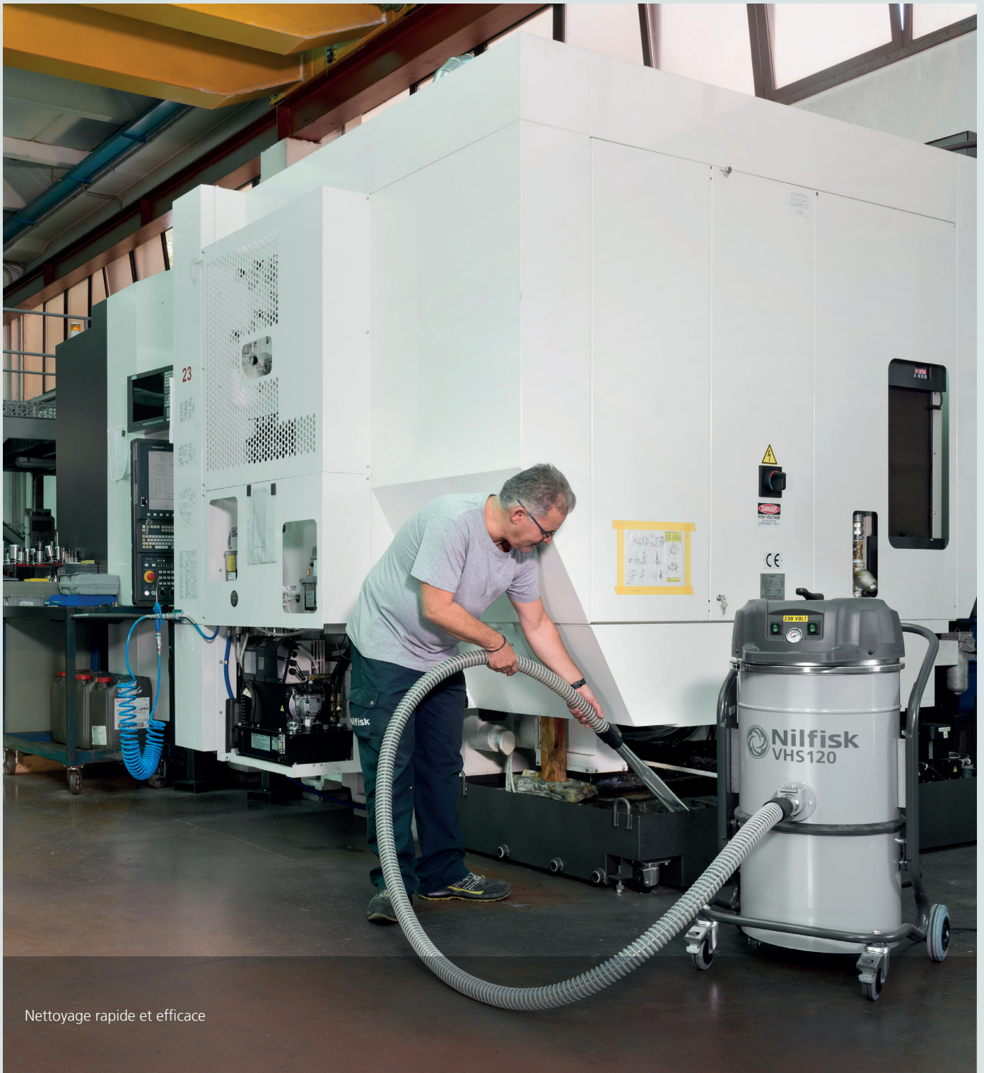
Nettoyage rapide et efficace