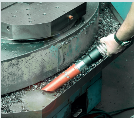
Pour l'aspiration de déchets secs ou humides